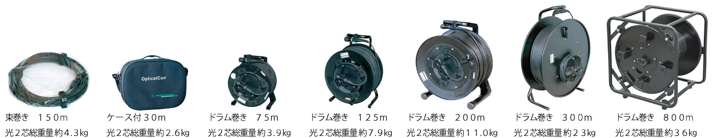
束巻き 150m 光2芯総重量約4.3kg