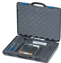
CAS-FOCD-ADV クリーニングキット