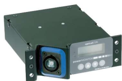
NO2*4F2RPM-A 光回線の減衰をリアルタイムで測定